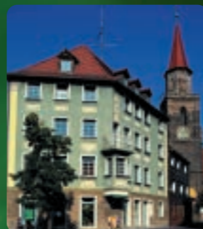
Gustavstraße und St. Michael